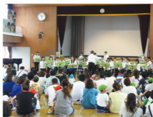
体育施設での演奏