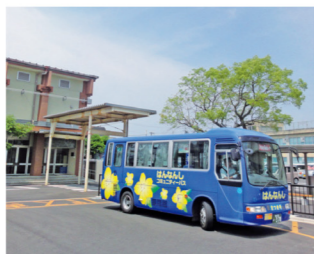
コミュニティバスが乗り入れ