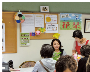
総合情報コーナー