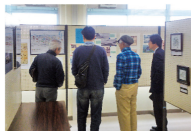
活動ルームでの展示