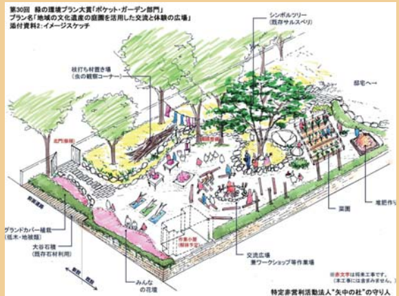
第30回 国土交通大臣賞 特定非営利活動法人「矢中の杜」の守り人

日常的な花や緑の活動を通して、地域の活性化や子どもたちへの情操教育、身近な環境の改善に寄与するプランを募集します。