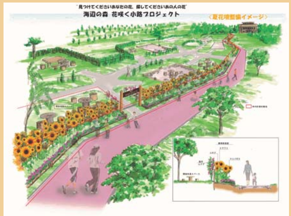
第30回 コミュニティ大賞 NPO法人森の会