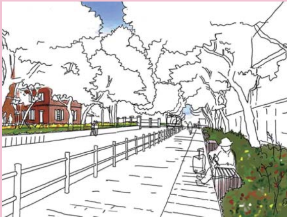
第30回 国土交通大臣賞 東京藝術大学キャンパスグランドデザイン推進室

地域のシンボリックな緑地として人と自然が共生する都市環境の形成、地域の活性化に寄与するプランを募集します。