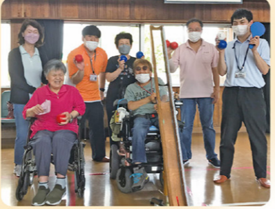
ひとりでも気軽に参加してください。一緒にポッチャを楽しみましょう。