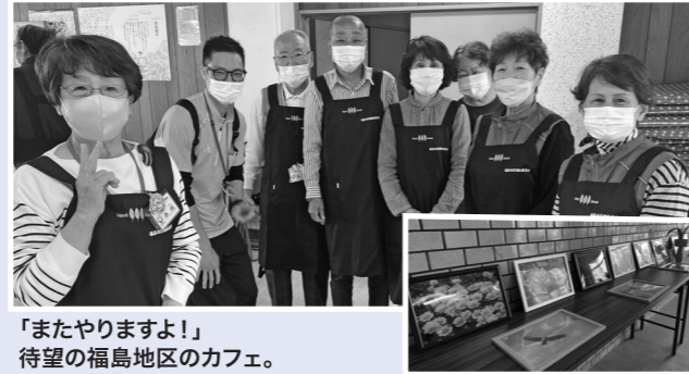
「またやりますよ!」 待望の福島地区のカフェ。

「みなさんとお話できて楽しい気持ちになりました」「また来たい!」と参加した地域の方々は笑顔いっぱい。6月には地域の方が撮影した写真を展示し、カフェはギャラリーの雰囲気。内容も充実、地域とのつながりを絶やさないための活動が進んでいます。