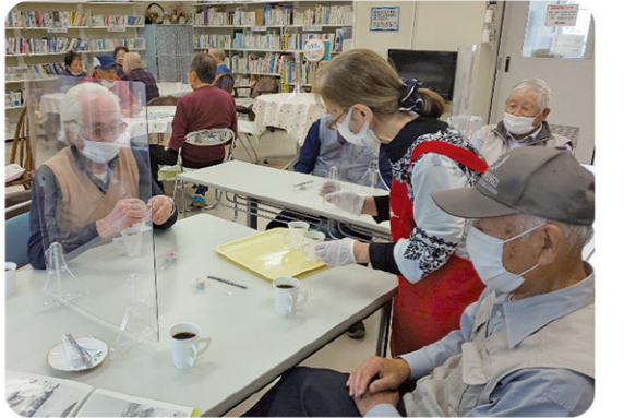
オープン初日から、待ってました!とばかりに、大盛況。

※新型コロナウイルス感染症拡大状況により、実施内容を変更する場合がありますので、あらかじめご理解ご了承ください。