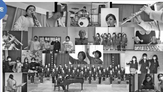
ホームページでは、桃の木台の風景とともに演奏が聴けます。