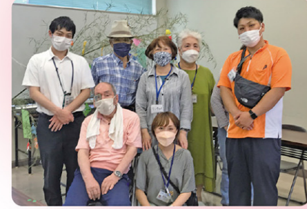
この日は七夕の笹飾り。きれいに飾った笹は、尾崎公民館のついで部屋でみなさんに楽しんでいただきました。

「きらきら」では、みなさんと一緒に季節の行事を楽しんだり、参加者の方に折り紙や健康体操を教えていただくなど、だれもが主役になれる、そんな居場所を目指して活動しています。