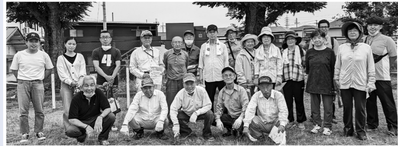
公園整備・花植えに、地域の方々や地域貢献活動として企業も参加してくれました。

青空のもと世代間交流を続けている上荘校区福祉委員会では、アダプト(美化活動ボランティア)や地域の方々の協力を得て、上荘小学校の3年生とともに花植え活動を行いました。花植えに先立ち、下出公園