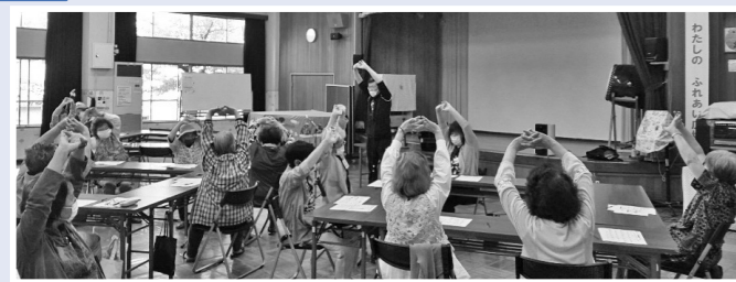
介護予防も取り入れた食事会となりました。

舞校区福祉委員会では、2日間に分けて食事会を開催。約50名の参加がありました! 食事を楽しむだけでなく、専門職によるお口の体操や市民病院からのフレイル予防の話も。「色々なお話を聞いて勉強になりました」「みんなでなつかしい歌をうたって楽しかった」など参加したみなさんに喜んでいただきました。