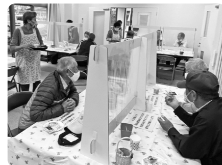
フレイル予防にも大切なサロン・カフェ活動。 ビニールの衝立を設置するなど、工夫を重ねて開催。