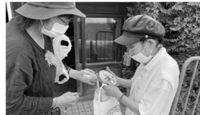
地域で様々な支え合い活動が実施されています。

協力金は500円からです。毎年、6月から募集の強化期間となっておりますので、ぜひご協力ください。