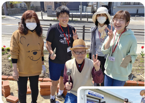
箱作の地域包括支援センター前の花壇がきれいになりました。花が咲いてまちの表情もやさしくなります。

「疲れたけど楽しかった」90歳過ぎてこんなに元気なことがすごい!」子どもたちからは充実感いっぱいのご感想がありました。