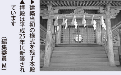
▲建築当初の様式を残す本殿 ▶拝殿は平成25年に新築されています (編集委員 M)

京都賀茂神社ゆかりの神社 箱作駅から浜街道(孝子越街道)を400mほど淡輪方面へ、せんなん里海公園に向かう小道沿いに「加茂神社」があります。大きな樹に囲まれた一角は、静かで凛とした空気に包まれています。 本殿は桃山時代の建物とされ、一間社流造(いっけんしゃながれづくり)という神社の代表的な建築様式です。また、屋根は阪南市に唯一残る檜皮葺(ひわだぶき)です。 ここには「タマヨリヒメノミコト」と「タカオカミ」が祀られています。タマヨリヒメノミコトは、813年、葵祭で有名な賀茂神社から箱作に分家してきたと言われています。都の神様をお迎えするというこで、社記には「社殿の造営にあたっては村民が協力し、土地を慣らし、良材を集めて完成させた」と書かれています。 なお、京都の上賀茂神社に残る平安時代末期の史料に、当時この箱作周辺が同神社領であったことが見られます。