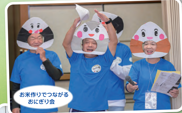
お米作りでつながる おにぎり会

和泉チエン 株式会社 M・Y2 INVESTMENT 株式会社 株式会社 アサヒ商会 イーグルジャパン いづみクリニック耳鼻咽喉科 西鳥取漁業協同組合 ナカイ製菓 株式会社 大規鮭し 有限会社 阪南防災 ショウケン工業 株式会社 一般社団法人やまなみ福祉会 大阪螺子販売 株式会社 (敬称略・順不同)