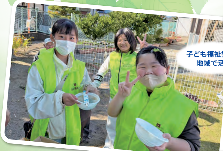
子ども福祉委員が 地域で活躍