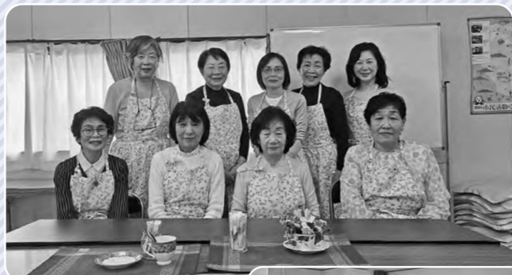
▲お揃いのエプロンでスタッフのみなさんの表情もいきいき! 「気軽に寄ってくださいね」 次々にお客さんが訪れ、おしゃべりと笑顔があふれています

「なかよしカフェ」という名前からも、誰もが親しみやすく、つながりを感じられる場所をめざす気持ちが伝わってきます。