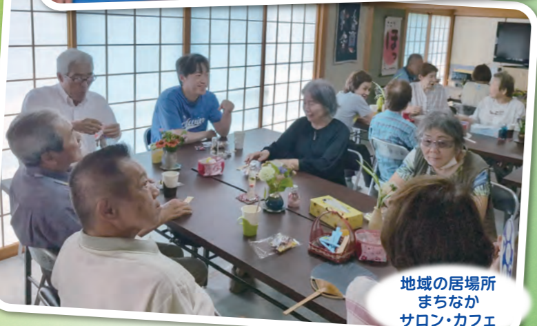
地域の居場所 まちなか サロン・カフェ