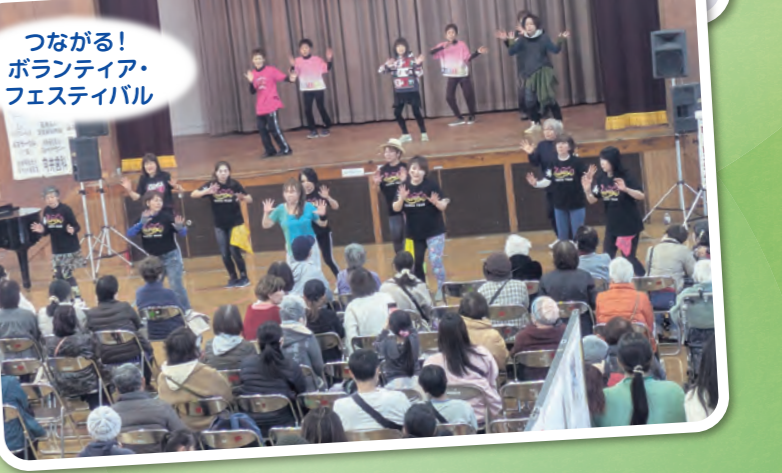
つながる！ ボランティア・ フェスティバル