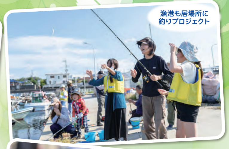
漁港も居場所に 釣りプロジェクト