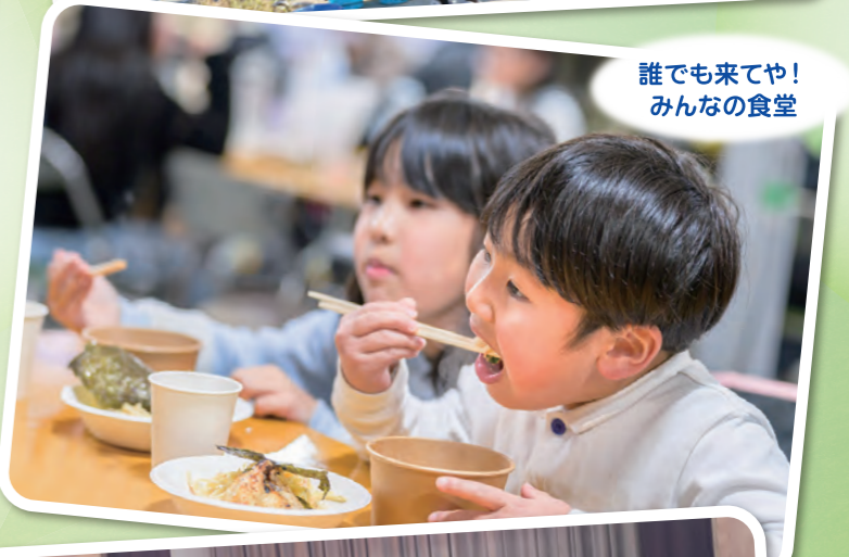
誰でも来てや！ みんなの食堂